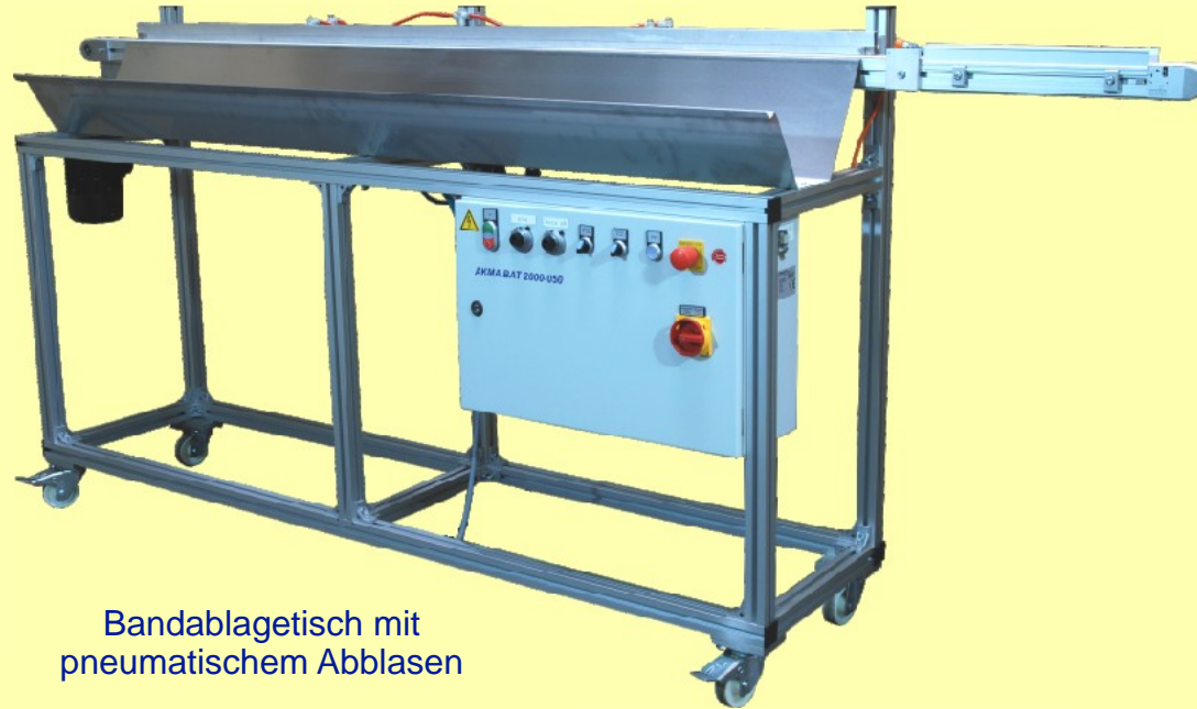
Bandablagetisch mit pneumatischem Abblasen