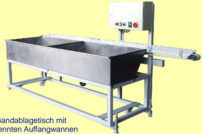
Bandablagetisch mit getrennten Auffangwannen