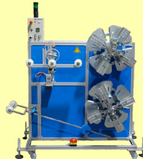
Doppelwickler mit vertikaler Anordnung der Haspeln