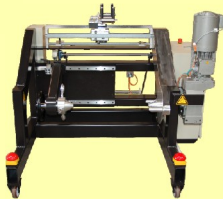
Wickler für schwere Spulen