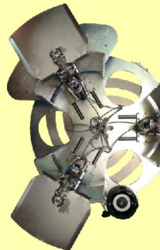
verstellbare, pneumatisch klappende Haspel