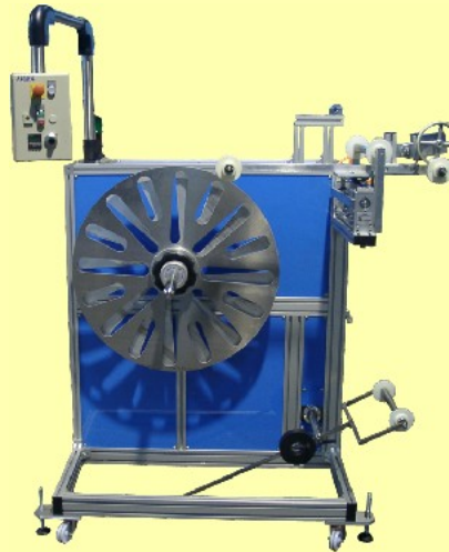
Einstationenwickler mit Haspel