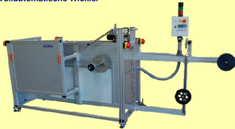
Doppelwickler für Spulen, mit servobetriebener Verlegung