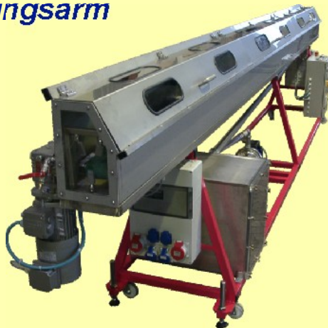
Sprühkühlung mit Transportband

schmale, offene Bauform flexibel nutzbar leichte Handhabung wartungsarm