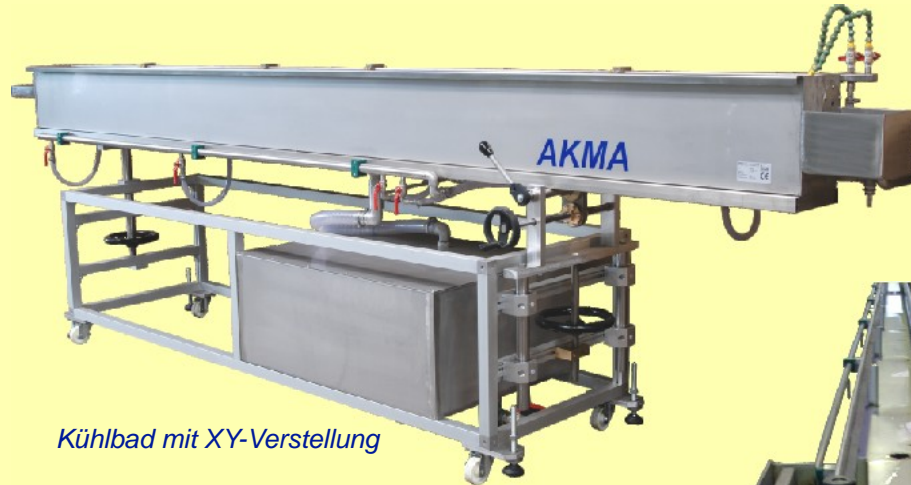
Kühlbad mit XY-Verstellung

Wir liefern Vakuumbäder, Kalibriertische und Kühlbecken kundenspezifisch auf den jeweiligen Anwendungsfall abgestimmt.